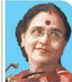
N. Rajam Art