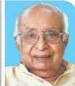
K.T. Thomas Public Affairs