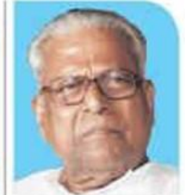
V.S. Achuthanandan Public Affairs (Posthumous)