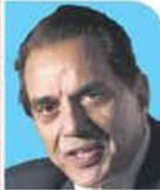
Dharmendra Singh Deol Art (Posthumous)